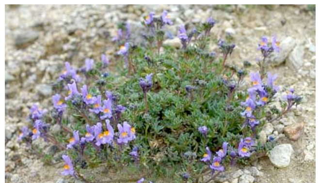
La linaria alpina si trova in luoghi sabbiosi e umidi