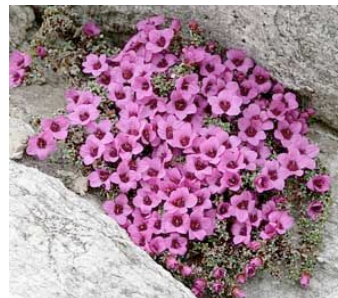
Sassifraga a foglie opposte, una delle 15 sassifraghe della Valle