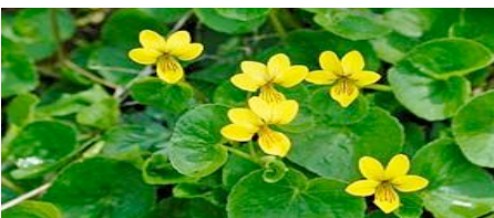
Viola biflora, luoghi umidi ombreggiati