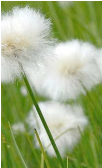
Pennacchi di Scheuchzer