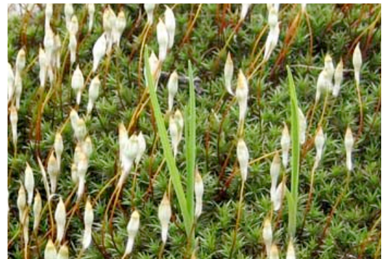
Polytrichum, una delle > 200 specie di muschi