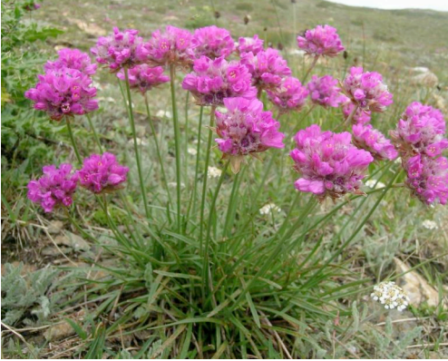
L'armeria alpina c'è solo nelle Alpi ticinesi, vallesane e grigionesi