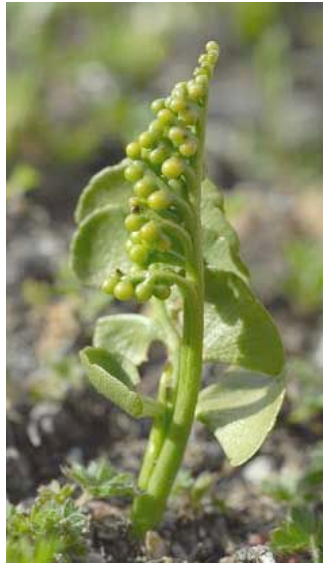
L'Erba lunaria, simile alle felci, con spore invece di semi