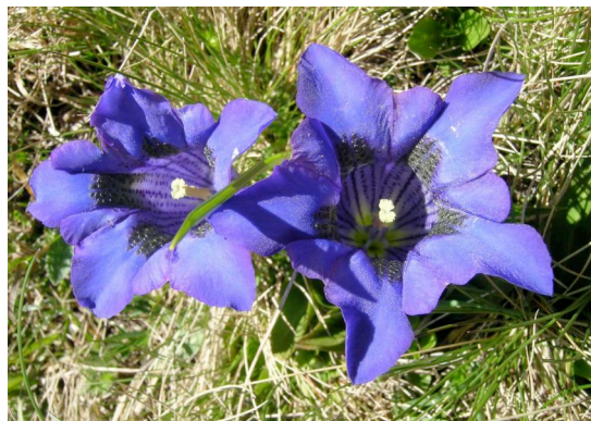
Genziana acaule, una delle 14 specie di genziane della V. Bedretto (in Svizzera 28)