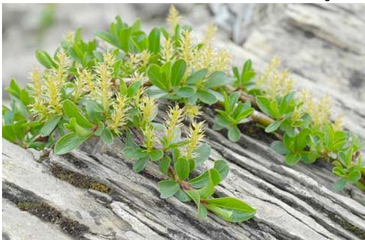
Salice retuso, uno degli "alberi" più piccoli del mondo, alto 2-8 cm